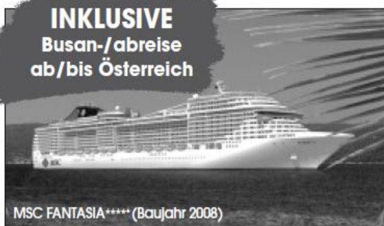
MSC FANTASIA***** (Baujahr 2008)

INKLUSIVE Busan-/abreise ab/bis Österreich